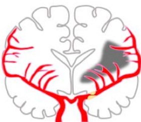
アテローム血栓性脳梗塞